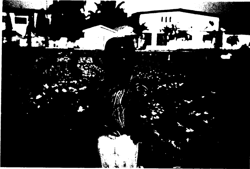
Şekil 1. Gana’da atıksu ile sulama

Ancak nitrat miktarları çok yüksek olan geri kazanım suları bitki gelişimine engel teşkil edebilmektedir. Ayrıca, sürekli geri kazanım sularıyla sulanan topraklarda tuzlanma, çözülmüş katıların ve ağır metallerin birikmesi gibi sorunlar oluşabilmektedir. Bu nedenle bu suların sulamada kullanımında toprak kalitesine ve sulanacak bitki türüne göre sulama yapılması önem taşımaktadır. Geri kazanım suları çoğunlukla yem bitkilerinin, lifli bitkilerin, sınırlı olmakla birlikte orkide bahçelerinin ve üzüm bağlarının sulanmasında kullanılmaktadır.